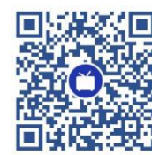
B 站 安装教程